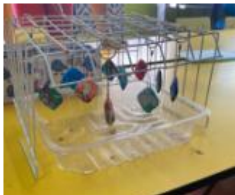
Os porta-chaves expostos