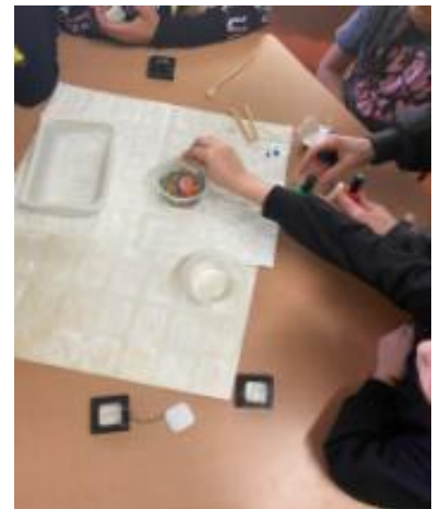
Minucioso trabalho de pintura