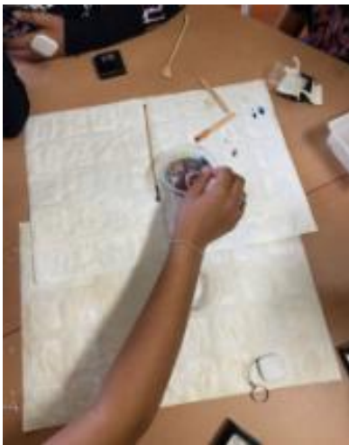
Confecção das ofertas

Porque é também o dia de São José, pai adoptivo de Jesus e esposo da Virgem Santa Maria (mãe de Jesus), que acolheu o Menino e O amou durante toda a sua vida.