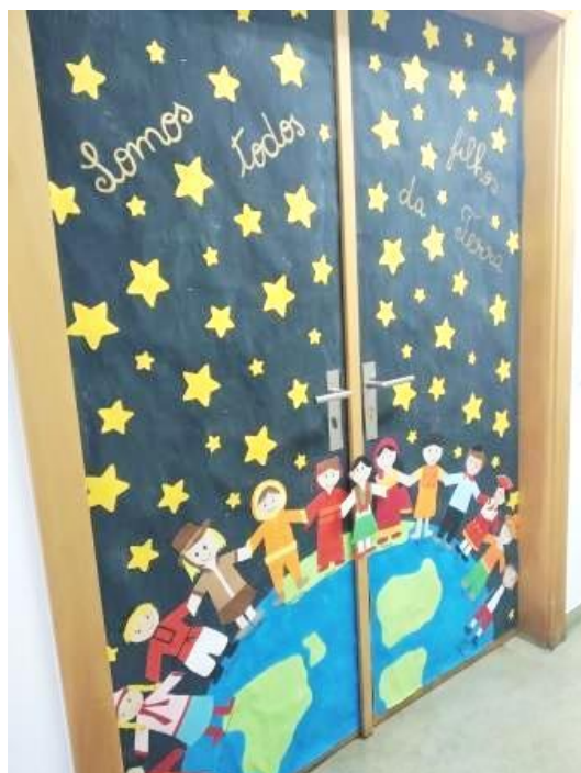
“Somos todos filhos da Terra”

Cai a água da torneira Faz espuma com sabão Eu vou lavar as mãozinhas Para evitar a infecção.