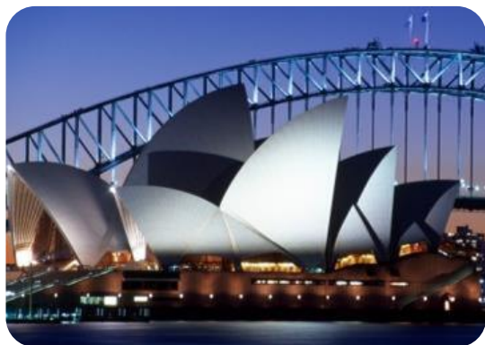
A Casa da Ópera, em Sydney, é um dos locais mais visitados deste país.

Riquezas Naturais: petróleo, carvão, minério de ferro, chumbo, zinco, petróleo e gás natural