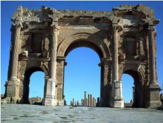
Arco de Trajano

A nossa visita foi de 4 a 15 de Fevereiro . A Argélia é o maior país de África.. Uma grande parte da sua área é deserto e é banhada pelo Mar Mediterrâneo a norte. Ficámos a conhecer a sua capital.