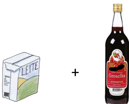
Quando o calor apareceu...

Aprendemos a fazer gelado de groselha, com os seguintes ingredientes: