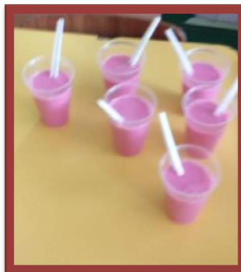
Prontos para o frigorífico!