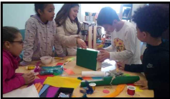
Construindo uma maqueta...