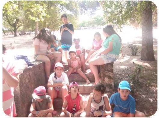
Dia de Gincana