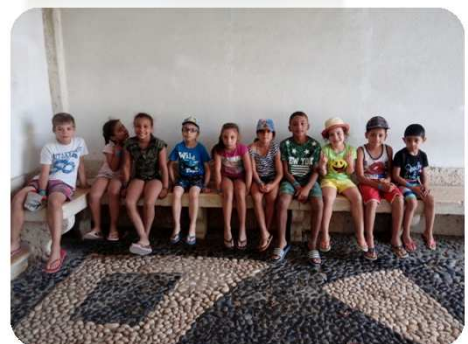
Museu do Traje