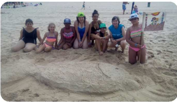
Construções na areia