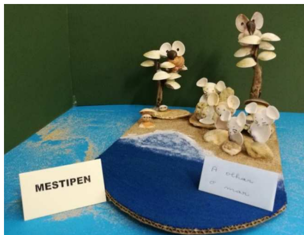
Trabalhos com conchas.

Iniciámos este ano lectivo com o habitual acolhimento e identificação de cada um. Assim, cada utente fez um cartão com a sua identificação pessoal. Posteriormente e recordando as férias de verão, fizemos duas belíssimas obras de arte com materiais que recolhemos durante a colónia de férias do final do passado ano lectivo.