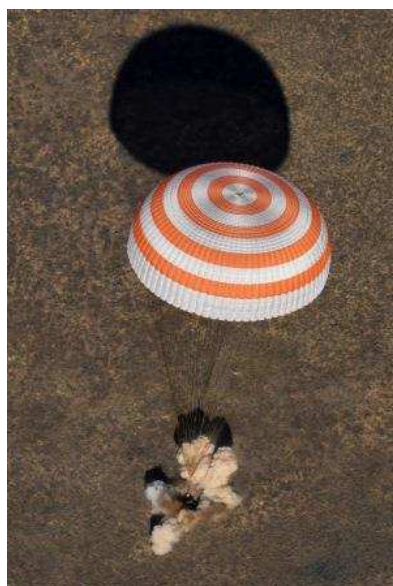
Aterragem da nave SOYOUZ MS-04