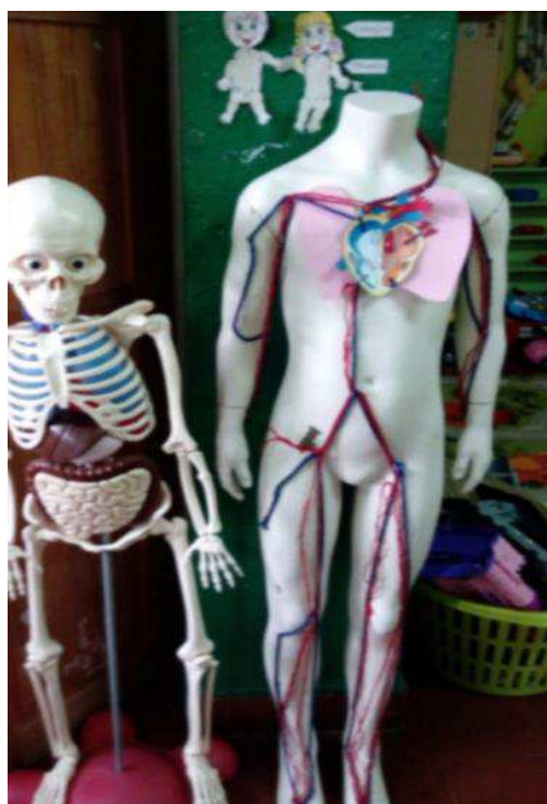
O corpo humano - aparelho circulatório

Dando conta das nossas capacidades de perceber, entender e sentir o mundo, recordámos os cinco sentidos do corpo humano e dois sistemas que são indispensáveis à vida: os Sistema Circulatório e Respiratório.