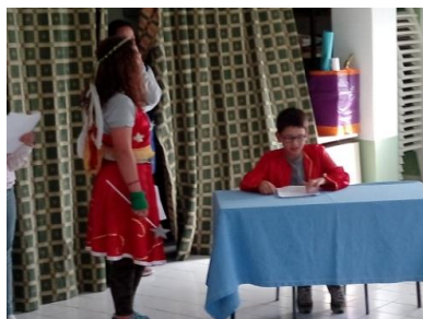
Oriana e o poeta