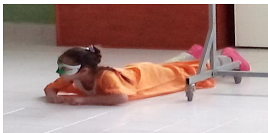
O pequeno peixe