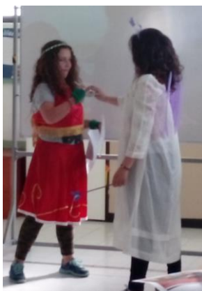
Oriana recupera as suas asas